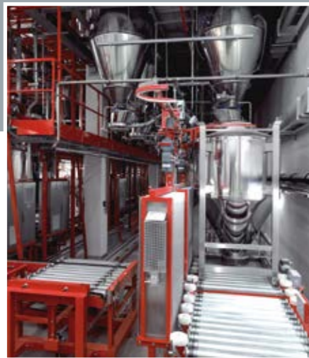
Containerbefüllung mit KAD – KOKEISL

Zeppelin hat die Lösung. Statt klassischer Rohrleitungen setzen wir mit ReciPure® auf mobile, den Rezepten zugeordnete Container. Diese Container werden je nach Bedarf automatisch bewegt. Ganz gleich, wie viele Zutaten und Rezepturen Ihre Produktion umfasst, mit dem ReciPure® System sind Sie jederzeit flexibel.