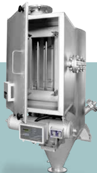
Totalabscheider mit 2-stufiger Filtration