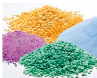
Masterbatches, Pigmente, Coatings